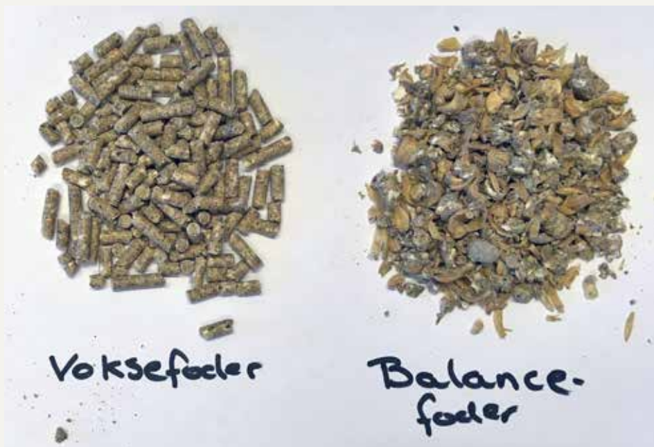
Billede 1: Foder benyttet i Forsøg 1. Det ses tydeligt at der er forskel på størrelsen af pillerne og strukturen, hvor fortyndingsfoderet indeholdt skaldele fra korn og hele kerner

Resultaterne viser, at fortyndingsfoderet benyttet i Forsøg 1 er en god velfærdsløsning, da det sikrer, at kyllingernes vækst holdes nede på det ønskede niveau uden, at kyllingerne oplever stressfulde perioder med restriktiv fodring. Fortyndingsfoderet havde tillige en markant positiv effekt på forekomsten og omfanget af trædepudesvidninger.